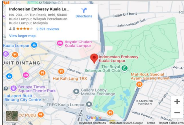
Gambar 1. Lokasi Gedung KBRI Kuala Lumpur di Malaysia